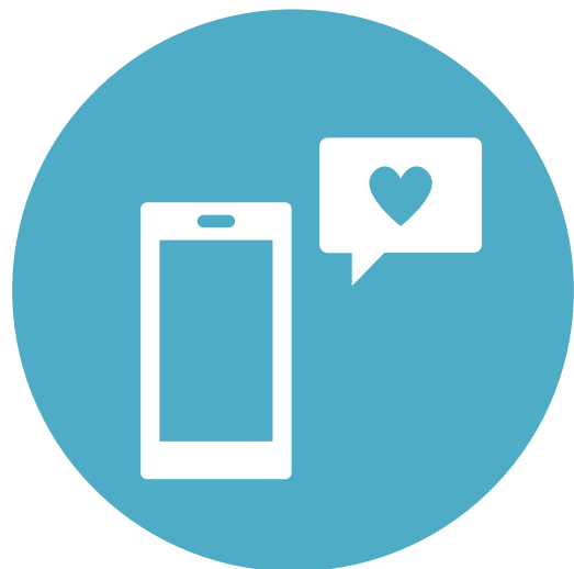
最適な啓発方法で届ける