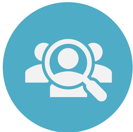
ターゲット層の選定